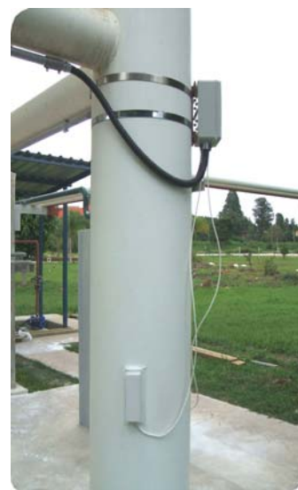
Microcell é marca registrada da Kistler morse Sujeito a alteração sem aviso prévio